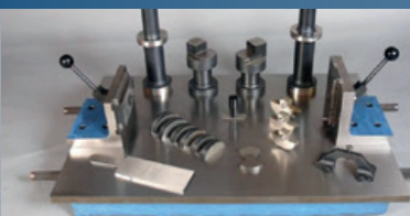
Gabarits de Contrôle