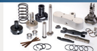
Pièces de rechange