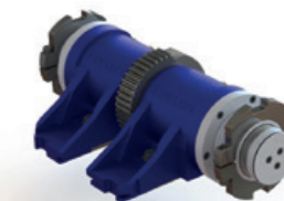
Mécanisme Moule de Bague

Nos années d'expérience et les milliers de pièces détachées que nous fournissons chaque année nous distinguent de nos concurrents. De nos mécanismes de collerettes, charnières porte-moules, bras à col annelé, têtes de soufflage, têtes de pince et bras d'extracteur, pour ne nommer que quelques-uns de nos produits, à notre vaste gamme de pièces de rechange et à nos instruments de contrôle, nous garantissons que vos machines sont prêtes pour une production impeccable de produits de haute qualité. Lattimer, synonyme de qualité, de cohérence, d'innovation et de fiabilité, est un nom sur lequel vous pouvez compter pour répondre à tous vos besoins en matière d'équipements variables IS. Appelez-nous dès maintenant.