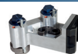
Têtes de soufflage